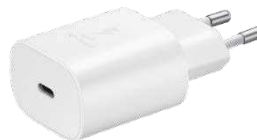
Schnelllade- adapter 25 Watt EP-TA800N