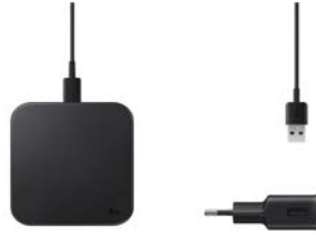
Wireless Charger Pad EP-P1300T