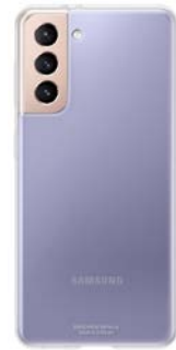
Clear Cover EF-QG991