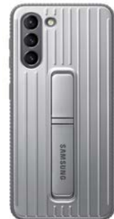
Protective Standing Cover EF-RG991