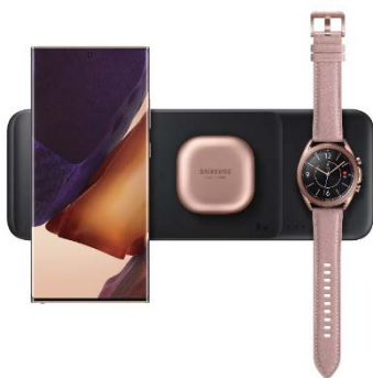
Wireless Charger Trio EP-P6300